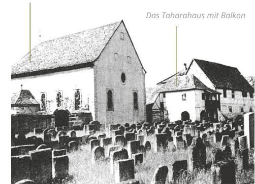
Das Taharahaus mit Balkon