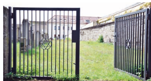
Heutiges Eingangstor des Jüdischen Friedhofs

Erst nach 1850 findet sich auch der Davidstern unter den verwendeten Symbolen. Während des Nationalsozialismus wurde der jüdische Friedhof geschändet. Auch wurden Grabsteine zur Pflasterung von Wegen und als Baumaterial u. a. für Häuser zweckentfremdet. Heute erinnert ein Gedenkstein an die jüdischen Opfer des Nationalsozialismus, der 1980 nahe der östlichen Mauer des Friedhofs errichtet worden ist.