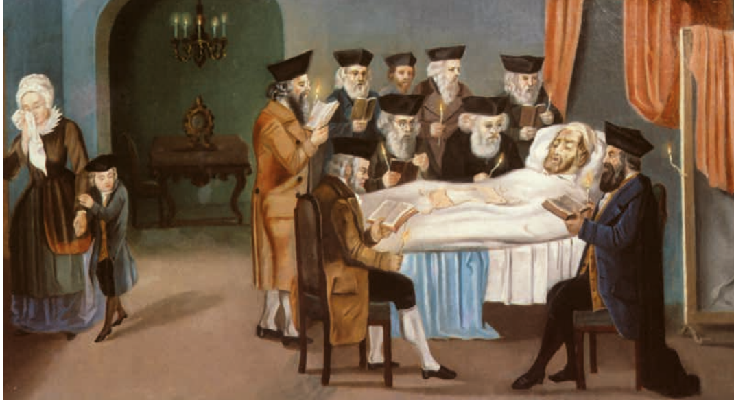
Die Chewra Kadischa am Lager des Sterbenden (1772), Jüdisches Museum, Prag