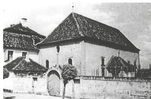
Das einstige Gemeindezentrum. Links im Anschnitt das Rabbinerhaus, rechts daneben die Synagoge und davor in der Mitte die Mikwe – das Tor in der Friedhofsmauer als Zugang zum Friedhof.

Da die Synagoge, das Taharahaushaus, die Mikwe und das Rabbinerhaus nicht mehr erhalten sind, weisen in der heutigen Zeit nur noch der jüdische Friedhof, vereinzelte Straßennamen (z. B. Seligmannstr., Merzbacherstr.), die Judengasse und eine Gedenktafel für die ehemalige Synagoge auf die große Bedeutung der jüdischen Gemeinde Baiersdorfs hin.