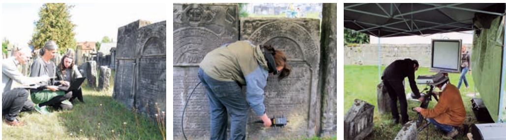
Student/-innen und Mitarbeiter/-innen der Universität Bamberg bei den Vorarbeiten zur Gesamtdokumentation des Friedhofs