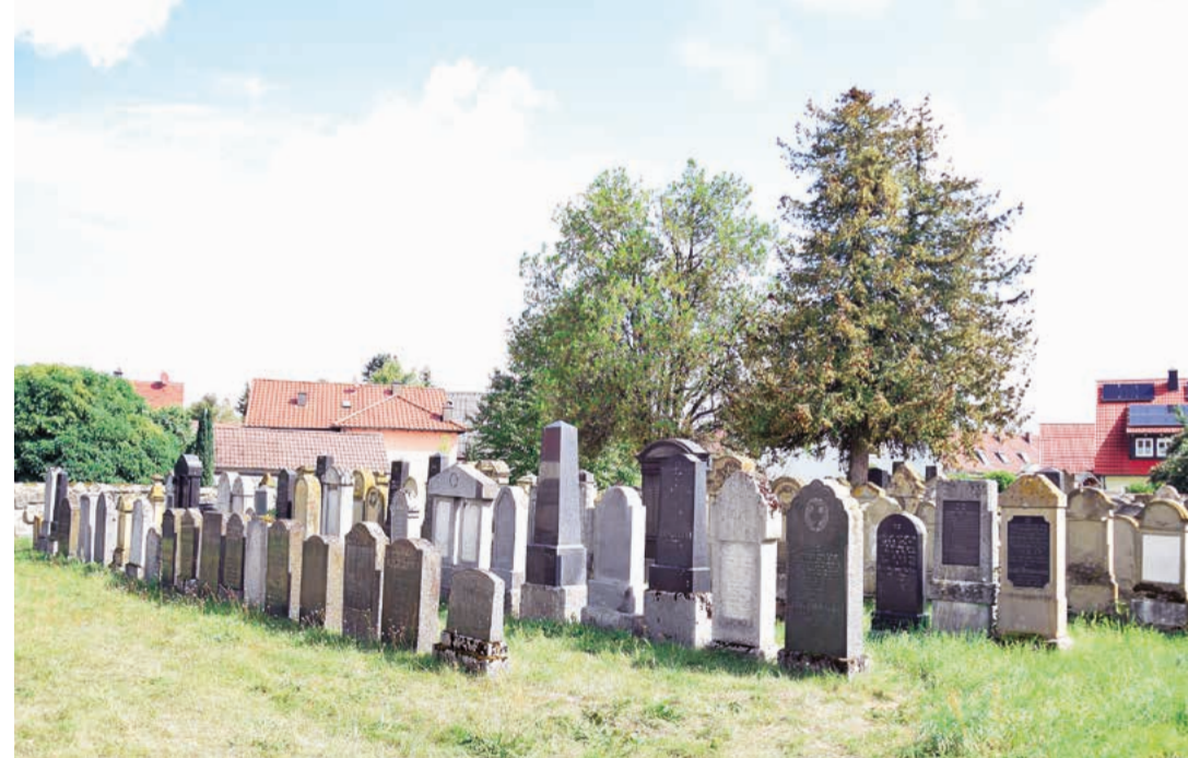
Einige Grabreihen auf dem jüngeren Teil des Friedhofs in der Nähe des heutigen Eingangs

Es folgen flexible Angaben zu Leben und Wirken: Die Namensnennung kann den amtlichen Rufnamen, den zum Gebet verwendeten jüdischen und unter Umständen auch den Kosenamen umfassen – bei Frauen zudem den Namen des Gatten. Die biographischen Informationen werden gelegentlich erweitert, häufig durch eine Funktion innerhalb der jüdischen Gemeinde. Hierbei kann auch auf Geburts-, Herkunfts- oder Wirkungsort eingegangen werden.