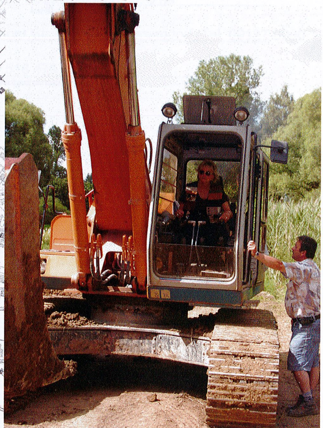
1. Spatenstich BA 2 am 4. Juli 2001